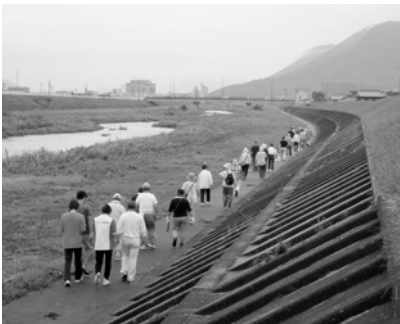
新川河川敷を歩く参加者

取り組みの準備として、各ウォーキングコースを体協や自治会の方が実際に歩いて距離を測り、安全面も確認して地図に表していただきました。また、体協や保健委員会の皆さんを中心にラジオ体操やスタンプ押印などの係も決めて積極的に取り組んでいただきました。 また、参加者の意欲と意識を高めるために、出席カードを作り、参加の度に押印してもらいました。 最終回の東部運動公園ではラジオ体操、ウォーキングそして表彰式と甘酒接待を行いました。賞品の中の自家製の野菜や接待の甘酒等も含めて、手づくりの大きな事業をみんなできり遂げた達成感をそれぞれが感じました。 参加者の感想は、「楽しかった。」「四季の変化を感じつつおしゃべりをしながら歩けた。」「今後もこの取り組みを続けてほしい。」「というのも多くあり、『継続して取り組み健康づくりのきっかけ』になったようです。 古高松地区コミュニティ協議会は、これらの取り組みに対して優秀賞をいただくことができました。高松市ではこ