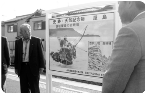
リニューアルした名所案内板

また、12月22日には、クリスマスイベントを開催しました。懐かしいフォークソングの演奏やつくし幼稚園の園児の歌やベルの演奏、ひょうたんクイズの結果発表などがありました。ぜんざいの接待もあり、心温まる手づくりのイベントになりました。