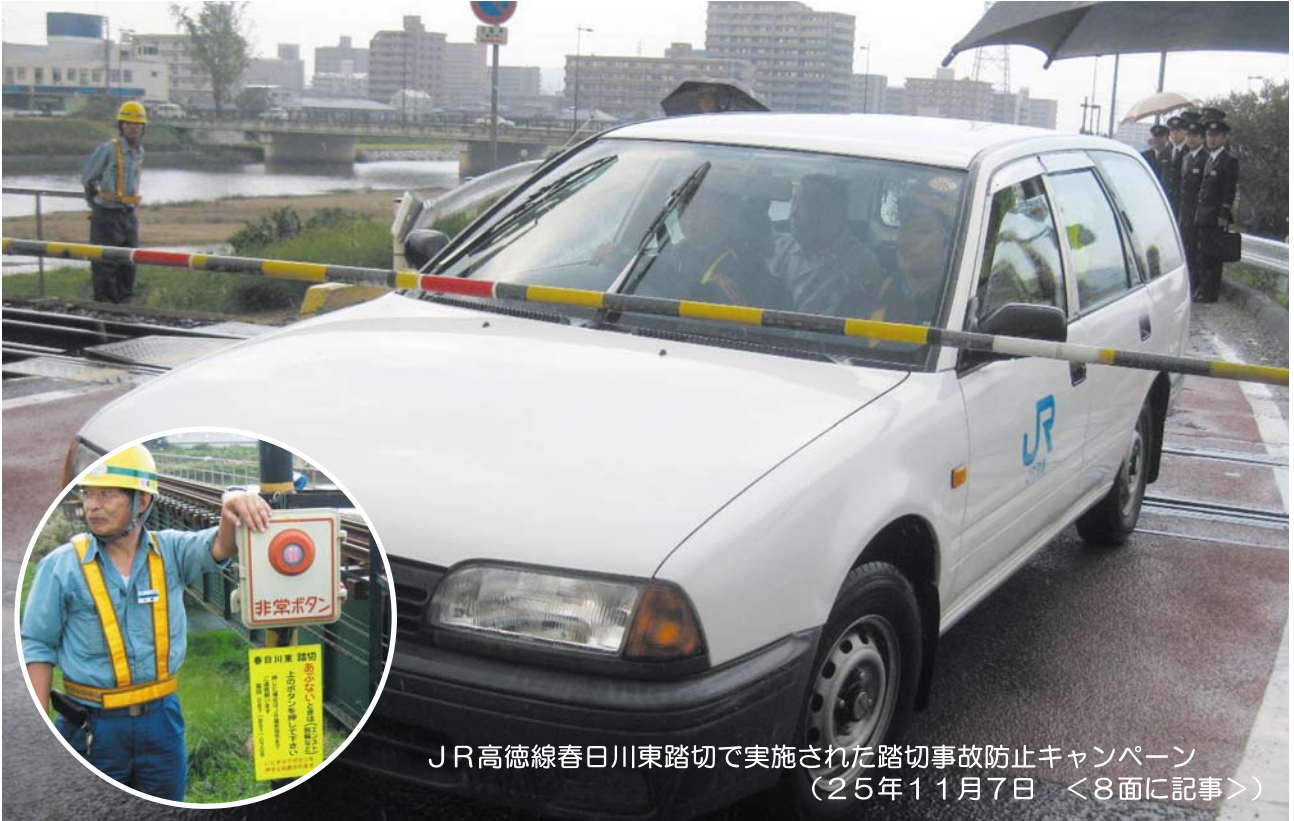
JR高徳線春日川東踏切で実施された踏切事故防止キャンペーン (25年11月7日 <8面に記事>)