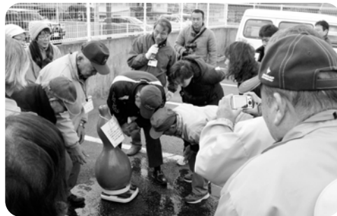
ひょうたんクイズでのコマ

営業時間 / 7時～11時30分 14時～18時 (JR券売業務を含む・年中無休)