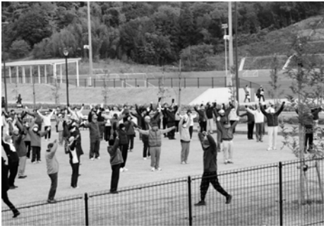
東部運動公園で参加者全員がラジオ体操

「高松市健康チャレンジ2013」は、運動や食事などの生活習慣の改善や、より多くの方が健診を受診されるよう、地域ぐるみで取り組んでいき、その中で優れた取り組みを表彰し、高松市全体への普及を図るものです。 当地区では、「古高松健康ウォーク」健康のためにウォーキングしませんか」というテーマで、九月から十一月まで取り組まれました。三町でそれぞれコースを設定し、水・土は各町のコースで、月二回土曜日は東部運動公園に全員が集まり、ラジオ体操とウォーキングを行いました。