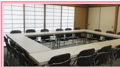
古高松南 コミュニティセンター 和室リニューアル しました。