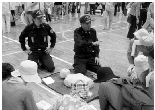
防災訓練でAEDの指導をする消防団員

消防団は、消防署等で働く消防職員と同じく、法律に基づいて市町村に設けられている消防機関で、香川県下全ての市町に設置されています。地域に最も身近な「消防団」の活動は、近年、ますます重要になってきており、「わがまちをわが手で守る」という使命感のもと、地域の防災リーダーとして活躍しています。 現在、古高松分団では団員男女を募集中です。詳しいお問い合わせは各コミュニティセンターへ。