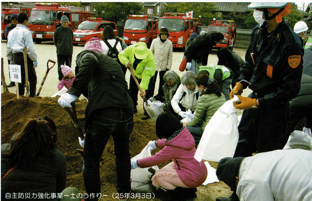
自主防災力強化事業—土のう作り— (25年3月3日)