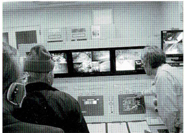
中央制御室の様相

姫路城大天守修理見学施設「天空の白鷺」は、大天守が素屋根で覆われている間、内部に見学スペースを設け、修理の様子が開かれています。漆喰壁の修理や屋根瓦のふき直しの様子など匠の技を間近で見ることができました。