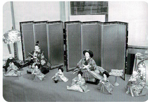
振興スペースを飾る雛人形