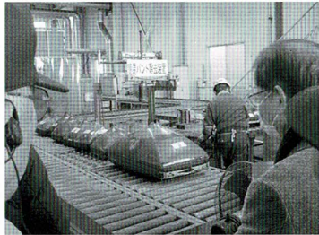
テレビの解体作業